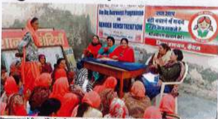
लिंगानुपात बढ़ाने के लिए आयोजित बैठक में स्वास्थ्य कार्यकर्ताओं से चर्चा करते महिला एवं बाल विकास विभाग की अधिकारी • जमना

उन्होंने बाल संरक्षण, बाल बचपन के अड्डे एक्ट, फैमिली एक्ट 2012 के अंतर्गत बाल के प्रायश्चित्त के बारे में भी जानकारी दी। बच्चों को चाइल्ड हेल्थकार्ड नंबर 10998 के बारे में बताया गया। इस मौके कई सुरक्षाकर्मी, शिक्षक, पेरेंट्स, एमिगर्स सहित मौजूद थे।