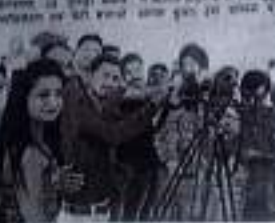
बेटी बचाओ-बेटी पढ़ाओ अभियान में भाग ले रही महिलाएं

Government is taking steps to boost the Beti Bachao scheme in Rajasthan. The scheme aims to improve the status of women and girls in the state. Government is taking steps to boost the Beti Bachao scheme in Rajasthan. The scheme aims to improve the status of women and girls in the state.