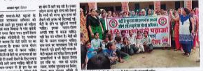
ककेरी गांव में लोहों को किचन मूसा आगरूक बेटी पर अत्याचार रोकने के लिए आगे आएंगे