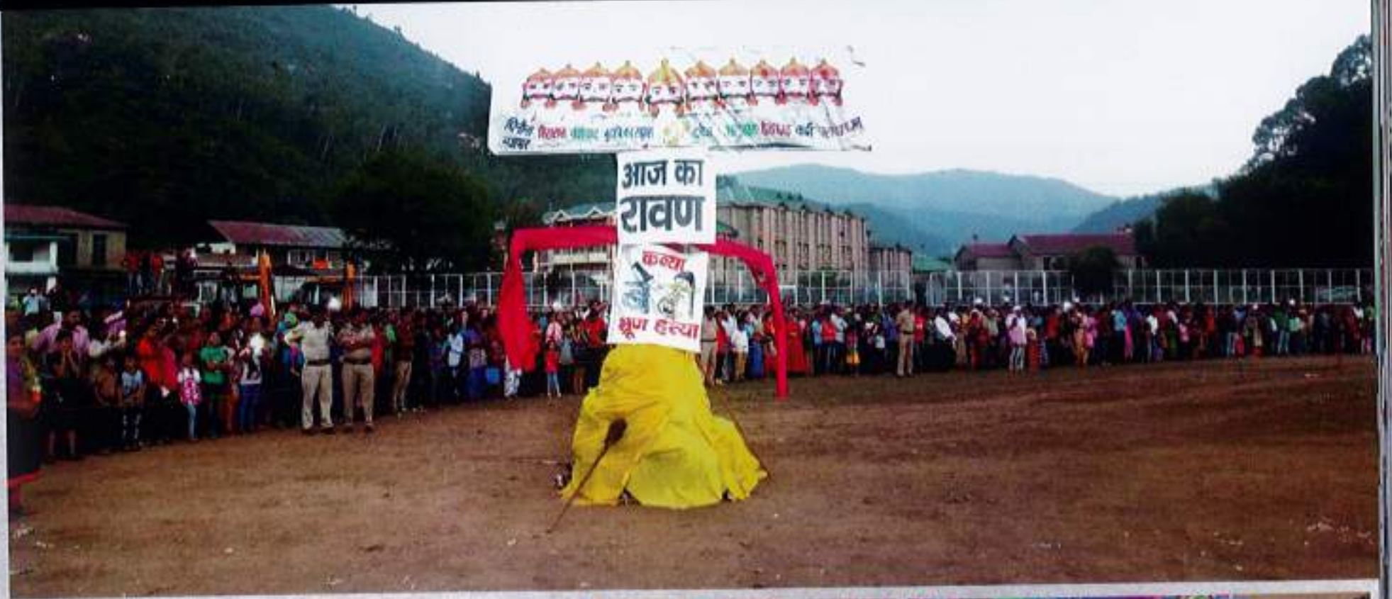
Dusshera celebrated with the theme of BBBP & Tree Plantation Drive