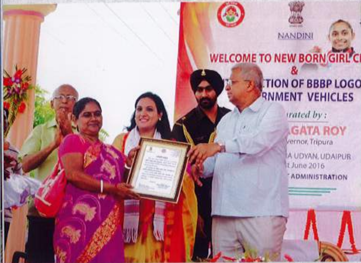
Ms. Dipa Karmakar has been felicitated with the honor of Golden Girl of Tripura