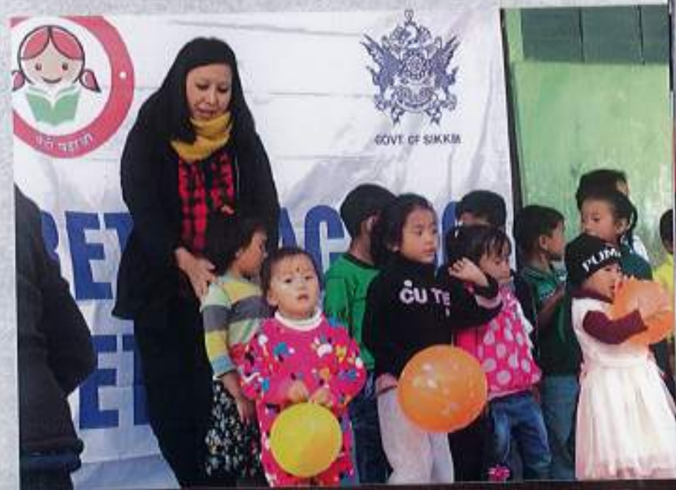
District level debate, elocution, essay and painting competition under BBBP