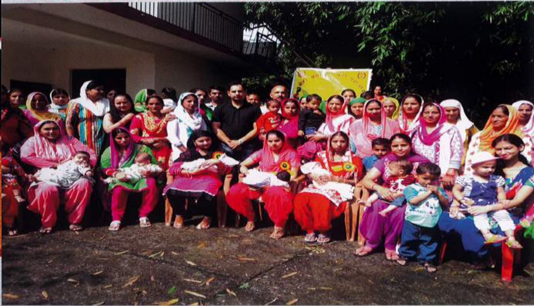
Mothers of newly born girl child being felicitated