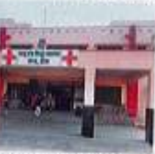
टीक, जिला प्रशासन का जन्म अक्वल अनुसंधान केंद्र

जिला में इस साल की जनगणना के अंत में टोंक जिला क्षेत्र में पहली बार अक्वल आया है। इस संख्या को देखते ही सरकार के अलावा सरकारी स्तर पर भी प्रयास किए जा रहे हैं। इस संदर्भ में जिला प्रशासन के अलावा सरकारी स्तर पर भी प्रयास किए जा रहे हैं।