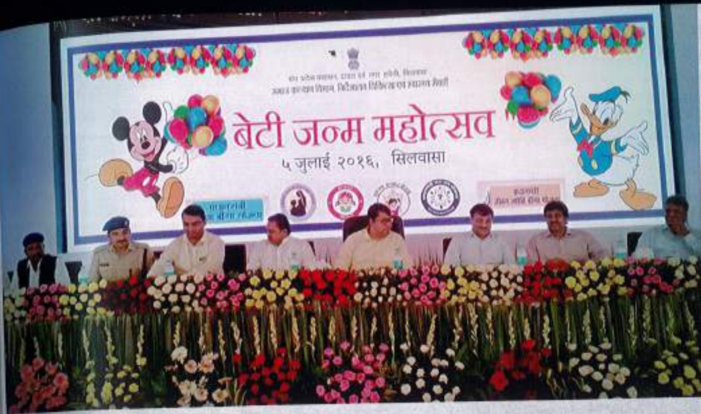
The UT Administration has celebrated "Beti Janm Mahotsav"