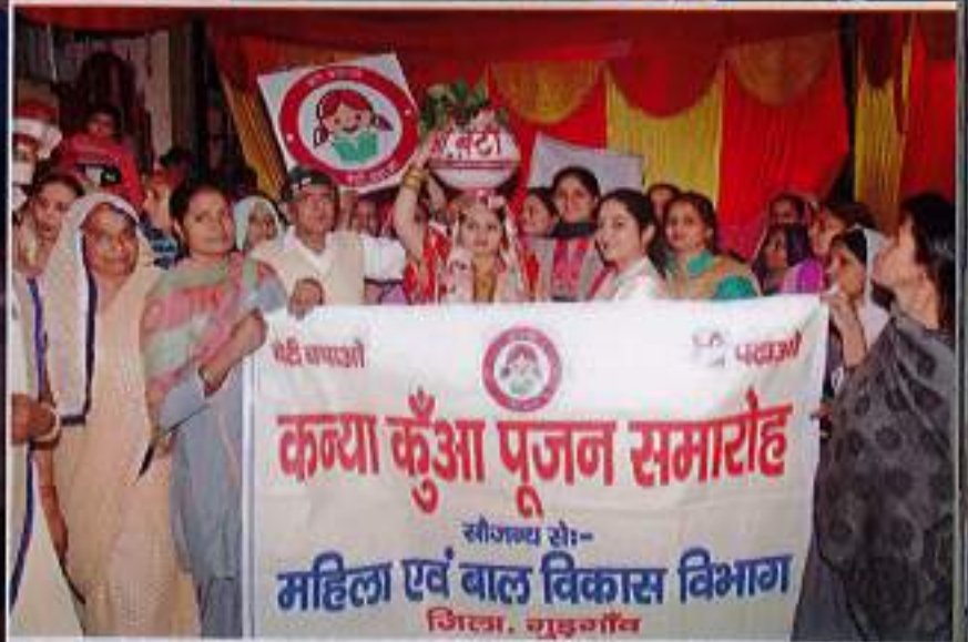
Traditional ceremonies of 'Kua Pujan' and 'Thali Bajao' associated with the birth of boys, is being celebrated for the birth of girl children too.