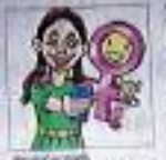
बेटी बचाओ-बेटी पढ़ाओ अभियान का लोगो

Teachers are being trained to boost the Centre's Beti Bachao scheme in Rajasthan. The scheme aims to improve the status of women and girls in the state. Teachers are being trained to boost the Centre's Beti Bachao scheme in Rajasthan. The scheme aims to improve the status of women and girls in the state.